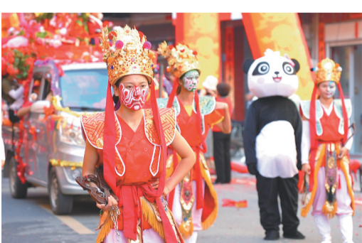
▲傳統與現代元素相輝映