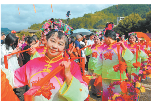
▲古裝人物吸引遊客