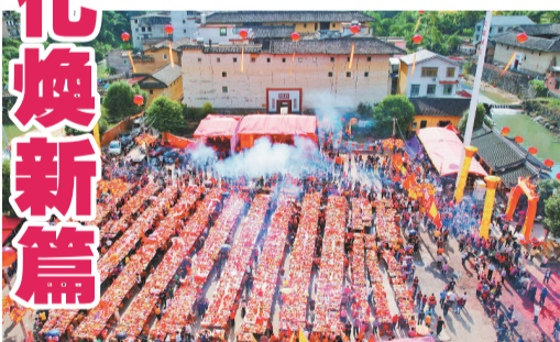
▲土樓三年一度的隆重節日